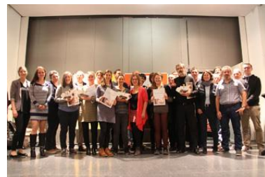
Die 20 Teilnehmer des ersten Zukunftslabors